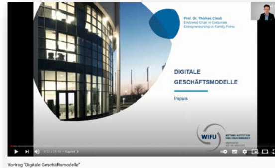
Vortrag "Digitale Geschäftsmodelle"

ist geschäftsführender Direktor des WIFU und Vorstand der gemeinnützigen WIFU-Stiftung. Nach Abschluss eines wirtschaftswissenschaftlichen Studiums war er mehrere Jahre für die Inhouseberatung eines großen internationalen Industriekonzerns sowie für Restrukturierungs- und Sanierungsberatungen tätig. Seit 2015 ist er zudem Honorarprofessor der Wirtschaftsfakultät der Universität Witten/ Herdecke. Schwerpunkt seiner Forschungs-/Lehr-, Beratungs- und Publikationstätigkeit bildet die Untersuchung von Konflikt- und Krisendynamiken, des strukturellen Risikos von Familienunternehmen, Mentaler Modelle in Unternehmerfamilien sowie von Familienstrategien und deren generationsübergreifender Evolution. Im Rahmen seiner Coaching- und Beratungstätigkeit unterstützt er Familienunternehmen und Unternehmerfamilien bei der Entwicklung praxisnaher Lösungskonzepte.