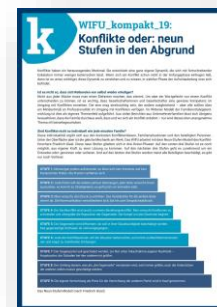
WIFU_kompakt 19 „Konflikte oder neun Stufen in den Abgrund“