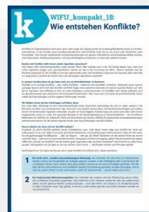
WIFU_kompakt 18 „Wie entstehen Konflikte?“

Zur Einstimmung auf das Thema und Vorbereitung des Online-Forums bitten wir Sie, sich mit den Inhalten der folgenden WIFU_kompakt Folgen vertraut zu machen: