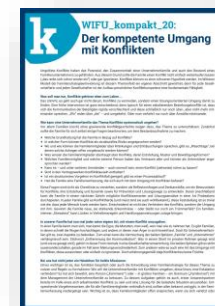
WIFU_kompakt 20 „Der kompetente Umgang mit Konflikten“

Viele der hier aufgeführten Publikationen, darunter sämtliche WIFU-Praxisleitfäden, finden Sie als kostenlosen Download auf unserer Homepage unter www.wifu.de/bibliothek .