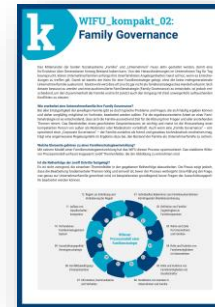
WIFU_kompakt 02 „Family Governance“

Alle WIFU-Publikationen finden Sie als kostenlosen Download auf unserer Homepage unter www.wifu.de/bibliothek .