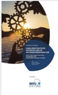
Familienstrategieentwicklung in Unternehmerfamilien (Praxisleitfaden)