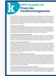
WIFU_kompakt 03 „Praxis des Familienmanagements“