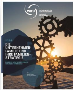
Die Unternehmerfamilie und ihre Familienstrategie (Studie)