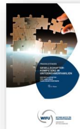
Praxisleitfaden Gesellschafterkompetenz in Unternehmerfamilien

Als umfangreiches Informationsmaterial zum Schwerpunktthema empfehlen wir Ihnen, nachfolgend aufgeführte Publikationen: