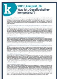
WIFU kompakt „Was ist Gesellschafterkompetenz?“

Zur Vorbereitung des WIFU-Online-Forums und Einstimmung auf das Thema bitten wir Sie, sich intensiv mit den Inhalten der nachfolgend aufgeführten Publikationen zu beschäftigen: