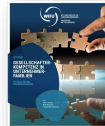
Studie Gesellschafterkompetenz in Unternehmerfamilien