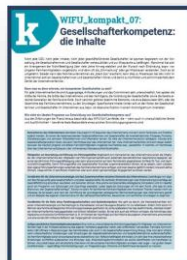
WIFU kompakt „Gesellschafterkompetenz: die Inhalte“