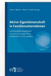
Buch Aktive Eigentümerschaft in Familienunternehmen