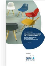
Praxisleitfaden Kommunikation in der Unternehmerfamilie