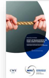
Praxisleitfaden Konfliktmanagement in Familienunternehmen