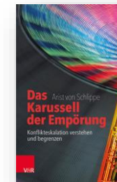
Buch Das Karussell der Empörung

Alle WIFU-Publikationen finden Sie als kostenlosen Download auf unserer Homepage unter www.wifu.de/bibliothek .