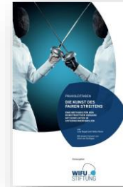
Praxisleitfaden Die Kunst des Fairen Streitens

Zur Vorbereitung des WIFU-Online-Forum und Einstimmung in das Thema und zur Vertiefung der Thematik im Anschluss an das Online-Forum empfehlen wir Ihnen folgende Publikationen. Die Schwerpunktthemenbearbeitung erfolgt nach dem Flipped-Classroom-Konzept.