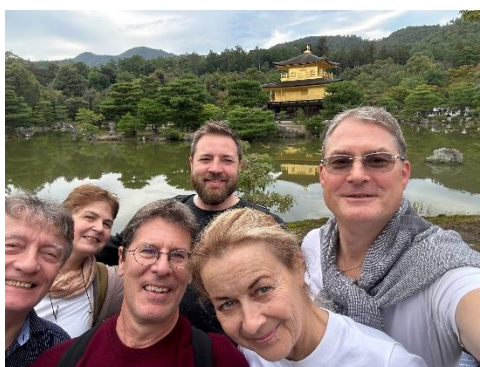
Am Goldenen Pavillon