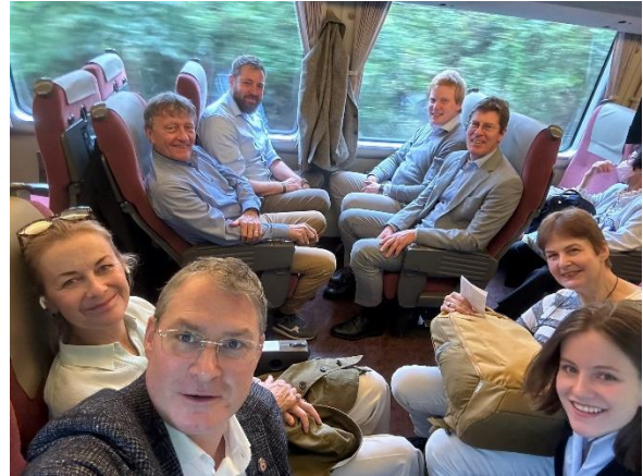
Mit dem WIFU auf Tour

Insgesamt zeigten sich alle Teilnehmenden beeindruckt von der Achtung, welche die japanischen Familienunternehmen ihrer Tradition entgegenbringen, wohlwissend, welche Aufgabe damit verbunden ist, ihren Traditionsbetrieb in die nächste Generation zu bringen. Dennoch blicken sie optimistisch in die Zukunft und stellen sich den Herausforderungen, die der Wandel in der schnelllebigen Zeit mit einer alternden japanischen Gesellschaft mit sich bringt.