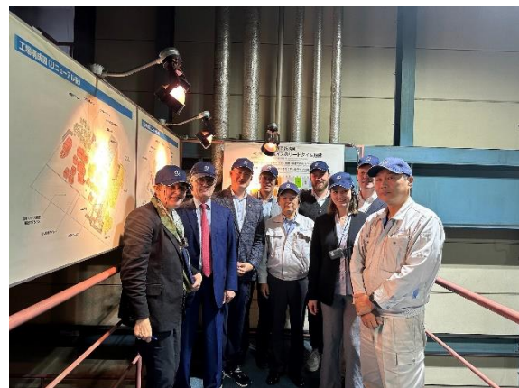
Werksführung bei Nabeya, Gifu