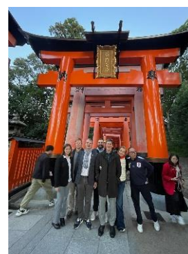
Am Fushimi Inari Großschrein