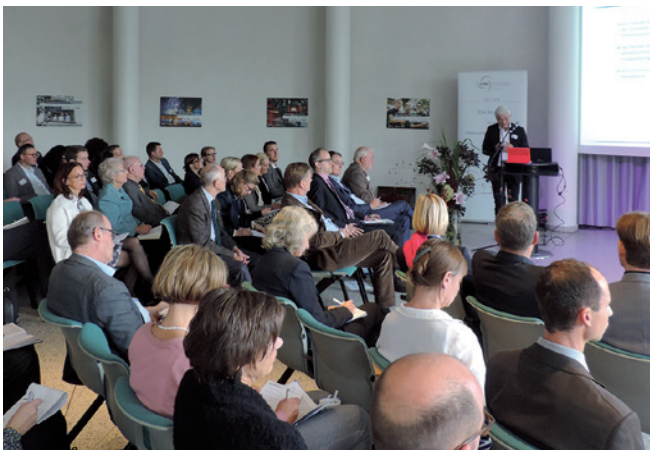
WIFU meets History 2017

Ihre Anmeldung nehmen wir gern bis zum 31. Oktober 2019 entgegen.