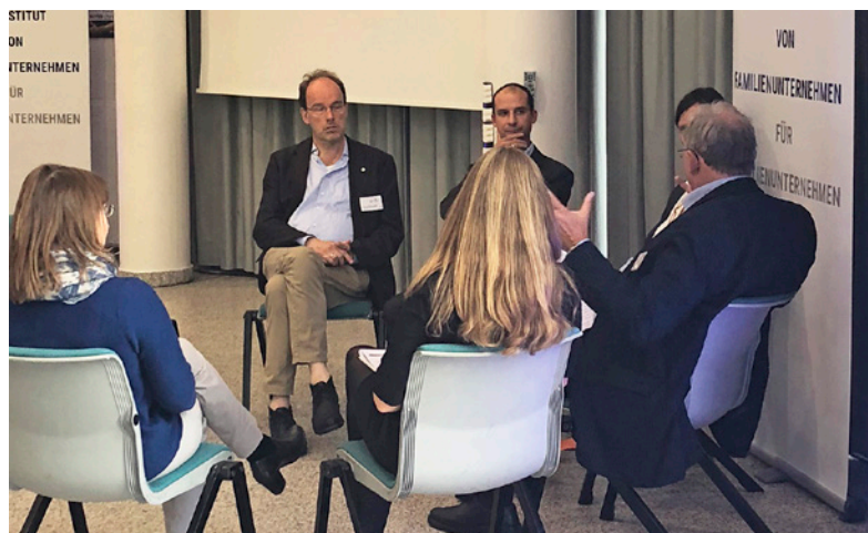
WIFU meets Sociology 2018