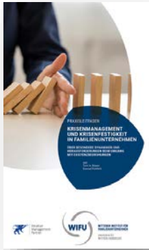
Praxisleitfaden „Krisenmanagement und Krisenfestigkeit in Familienunternehmen“