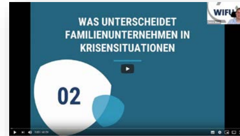
Vortrag „Krisen und deren Management in Familienunternehmen“