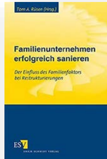
Buch „Familienunternehmen erfolgreich sanieren“