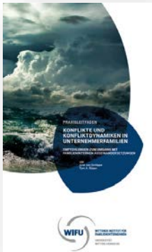
Praxisleitfaden „Konflikte und Konfliktdynamiken in Unternehmerfamilien“