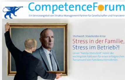
CompetenceForum „Family Stresstest“