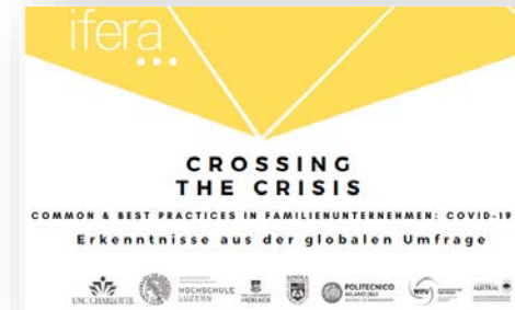
Studie „Crossing the crisis“