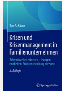
Buch „Krisen und Krisenmanagement in Familienunternehmen“